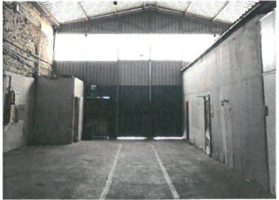
FOTO 04_vista del portone di Ingresso