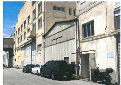
FOTO 01_ capannone Ovest da Via al Molo Vecchio