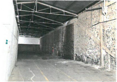
FOTO 03_vista dell'interno del capannone Ovest