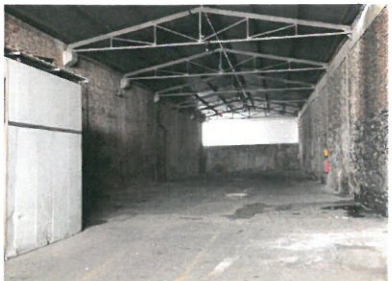
FOTO 02_vista dell'interno del capannone Ovest