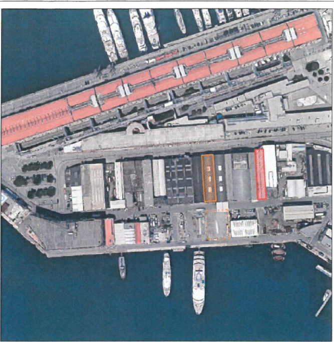
Stralcio Ortofoto_ scala 1:2.000